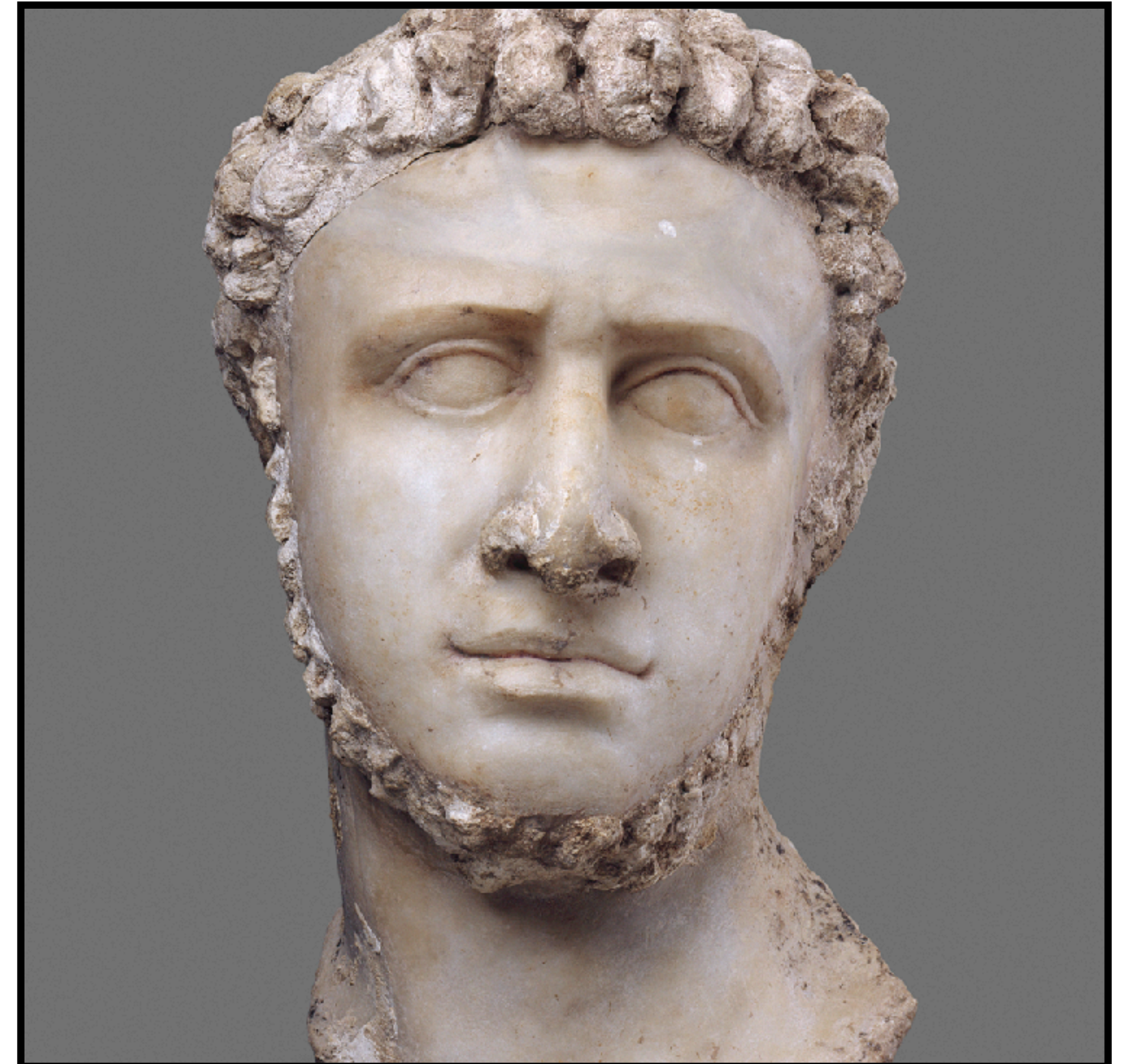
Herodes den store